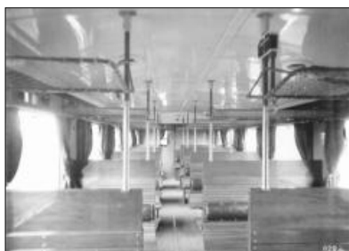
Interiér vozu M242.0