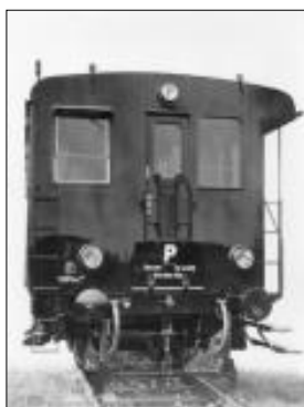
Přední čelo motorového vozu M122.028 z roku 1932