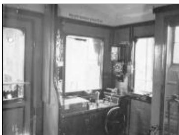
Zadní řídicí pult vozu M122.010 z roku 1930