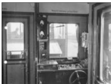
Přední řídicí pult vozu M122.010 z roku 1930