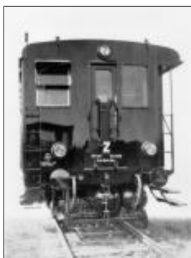
Zadní čelo motorového vozu M122.028 z roku 1932