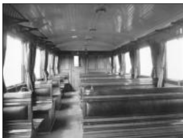
Interiér motorového vozu M122.028 z roku 1932