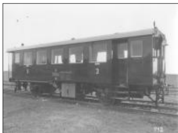
Motorový vůz M122.001 z roku 1930

Vozy byly vyrobeny ve 3 sériích. Skříň vozu byla řešena tak, že čelní stanoviště strojvedoucího byla zároveň nástupními plošinami. Prostor za nástupními dveřmi byl na jedné straně využit pro WC a na druhé plošině pro palivovou nádrž, která byla kryta sedadlem. Vytápění oddílu pro cestující bylo řešeno výfukovými plyny od motoru. Vůz měl celkem 48 míst k sezení.